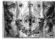
Visit our other websites:

קיימים גם מגזיני רשת. בדרך כלל הם פרי מחשבתו של יהודי